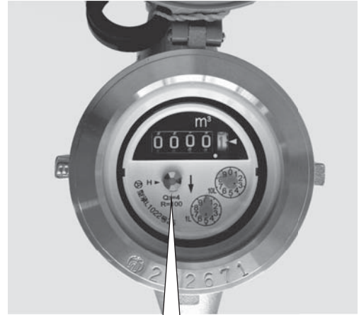
蛇口を閉めてメーターのパイロットが回っていたら漏水の可能性あり

※漏水調査・修理費用は、個人の負担となります。アパート等にお住まいの方は、家主にご連絡ください。