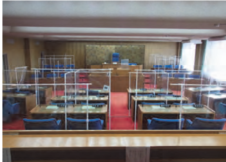
◀議場内に飛沫防止シートを設置