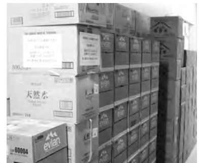
▲防災用備蓄飲料水

的に勘案して考えていきたいと思えます。今回の計画では、500ℓで11時間30分対応のタンクで実施していきます。