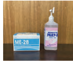
▲消毒液とマスクを設置