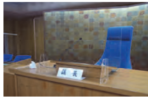
▼議長席にアクリル板を設置