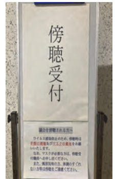
傍聴者へ協力依頼の貼紙▶