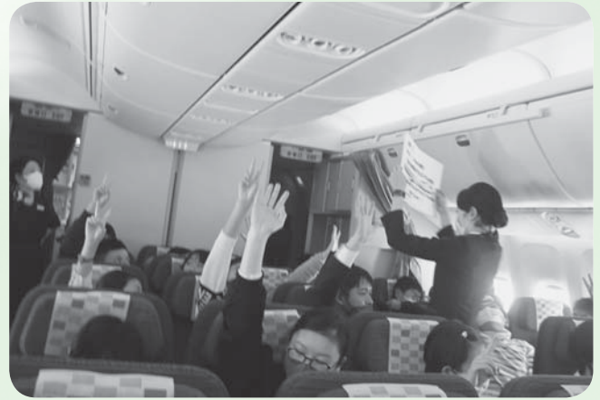
お仕事講座でのクイズ