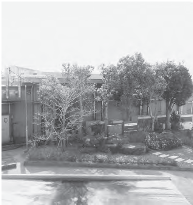
▲東陽食肉センター

①平成27年度から毎年度、財政調整基金を取り崩し、赤字補填を行っています。施設は、現在の場所に移転後52年が経