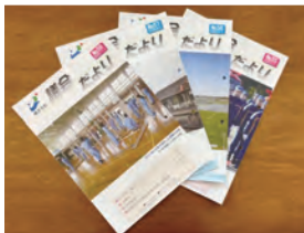
▲発行された議会だより