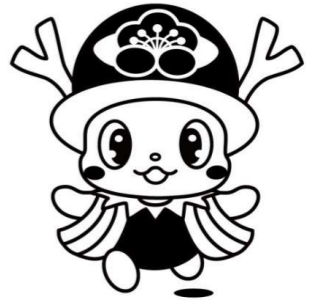
横芝光町マスコットキャラクター よこぴー