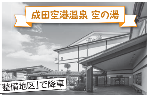
成田空港温泉 空の湯