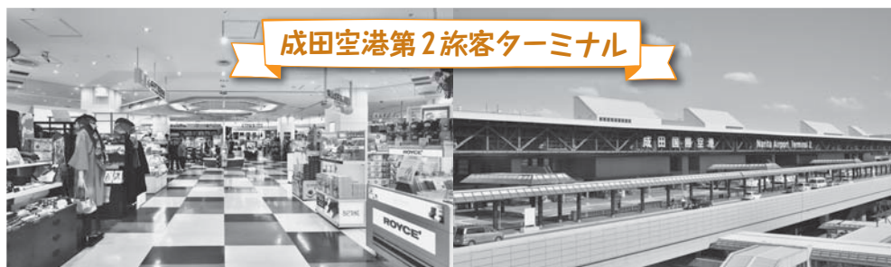
成田空港第2旅客ターミナル

成田空港は、ショッピングや食事など飛行機に乗る用事がなくても楽しめるスポットです。もちろん、展望デッキからは、飛行機の離発着もご覧になれます。