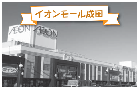
イオンモール成田