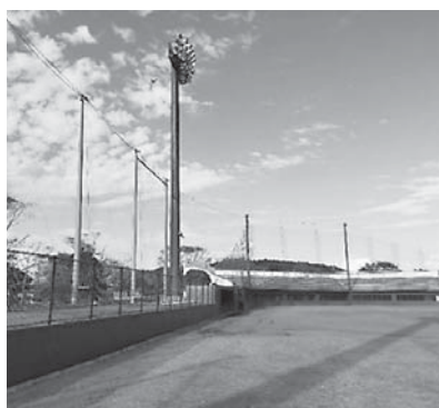
平成28年度 ふれあい坂田池公園野球場 防球ネット張替改修工事