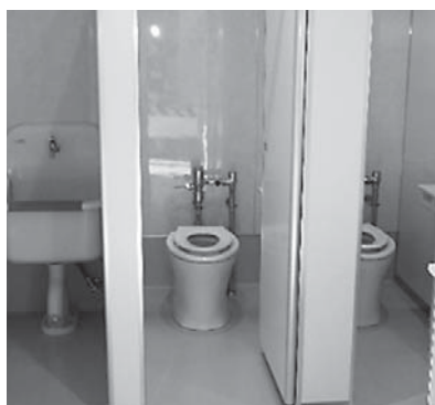
平成29年度 上堺小学校 トイレ改修工事