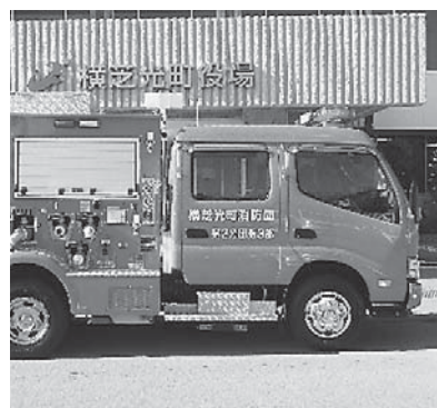
令和元年度 第2分団第3部 消防ポンプ自動車

成田空港の更なる機能強化によるC滑走路の完成は令和10年度末の計画ではありますが、今年4月1日に騒音区域は拡大されました。それに伴い、成田国際空港周辺対策交付金は今年度から増額される予定であり、これまで対象とならなかった教育や医療など幅広くまちづくりに活用できる『地域振興枠』が新設されました。