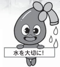
山武郡市広域水道企業団 マスコットキャラクター 「さんすいちゃん」