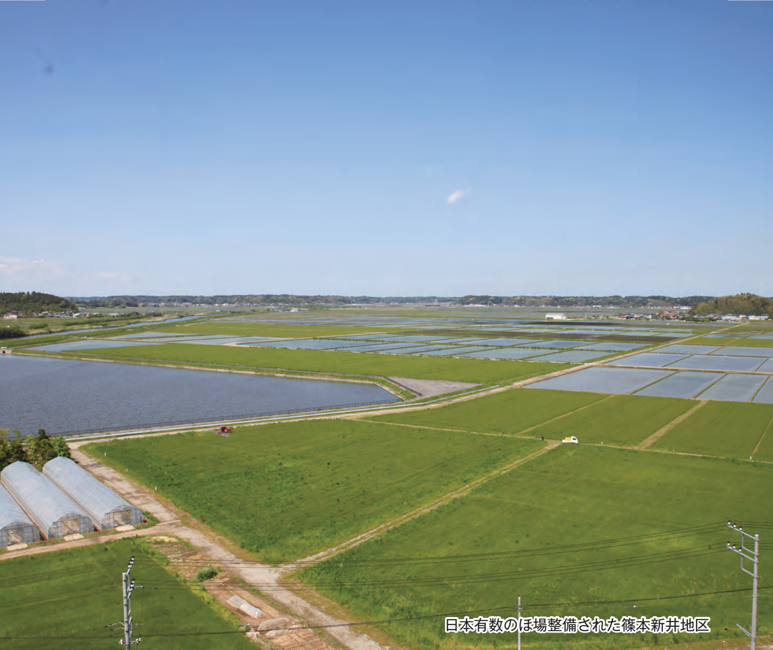
日本有数のほ場整備された篠本新井地区