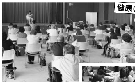
健康いきいき体操