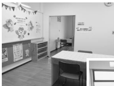
◀子育て世代包括支援センター