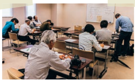
乾草沼の貴重な生物を守るため、特定外来種の除去とごみ拾いが実施されました。また、生物の分布状況を把握するための基礎資料の作成にも取り組んでいます。