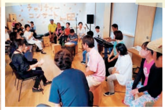
横芝駅前情報交流館「ヨリドコロ」で、カホンなどの打楽器を使ったチャリティーコンサートが開催されました。