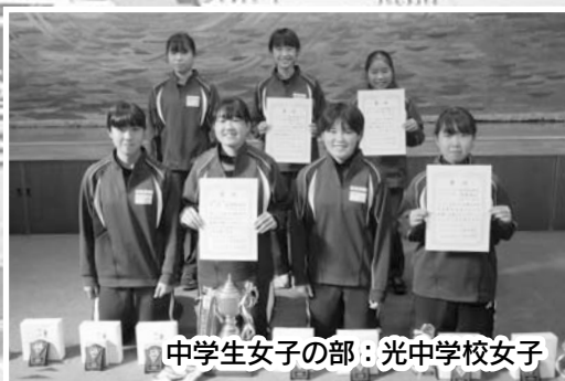
中学生女子の部：光中学校女子