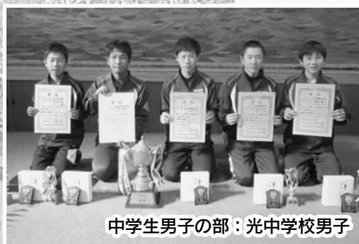
中学生男子の部：光中学校男子