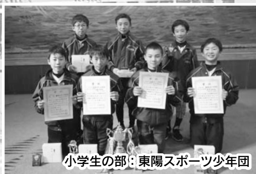
小学生の部：東陽スポーツ少年団