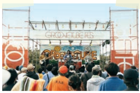
屋形海岸で、子どもから大人まで誰もが楽しめる野外音楽イベントが開催されました。