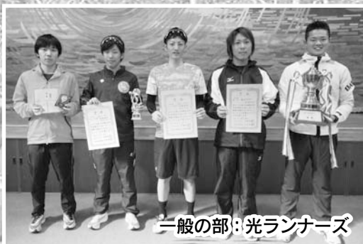
一般の部：光ランナース