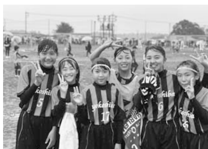
▲横芝FCなでしこ女子チーム

また、12月22日には15チームが参加してFC蓮沼BB杯フットサル大会が開催されました。出場した横芝FC6年生チームは、3チームによる予選リーグを全勝で勝ち進み、決勝トーナメントへと駒を進めました。準決勝はPK勝ちで決勝戦へ、決勝は惜しくもPK負けとなりましたが、見事に準優勝しました。