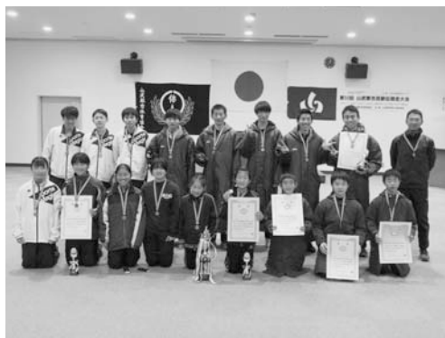
▲横芝光町チームのみなさん