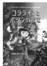
「コララインとボタンの魔女」