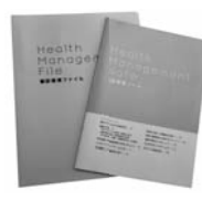
結果保存用ファイル