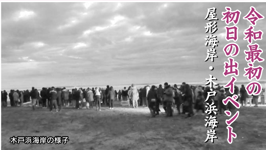
木戸浜海岸の様子