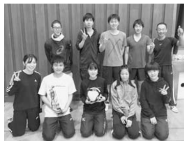
▲優勝した栗山チーム