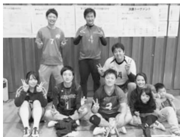
▲優勝した上堺チーム