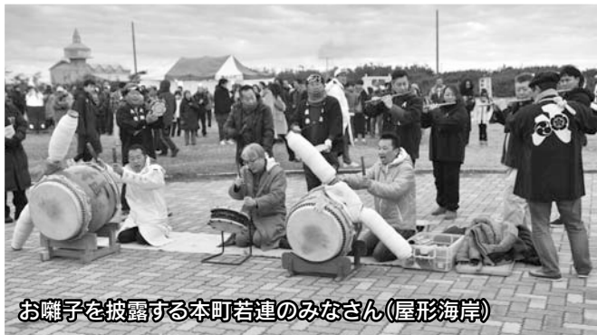
お囃子を披露する本町若連のみなさん(屋形海岸)

元日の早朝、町観光まちづくり協会主催の「初日の出イベント」が屋形海岸と木戸浜海岸で開催されました。屋形海岸では甘酒が、木戸浜海岸では姉妹町の神奈川県松田町から提供していただいた足柄茶が振る舞われたほか、両海岸では紅白もちが無料配布されました。当日は雲が空を覆い、水平線から昇る初日の出を見ることはできませんでしたが、令和最初の初日の出を見ようと、両海岸には合わせて2,500人が訪れ、新年のスタートを祝いました。