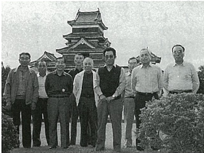
▲松本城で友の会のみなさん

旅行で取り入れの疲れを 7年前から西高野区では友の会を作り、月々の積立てで毎年楽しい交友旅行を楽しんでいます。 10月には、立山黒部アルペンルートと宇奈月温泉で秋の取り入れの疲れをほぐしてきました。立山黒部平での紅葉がとても目に映りました。 通信員 土屋清 (西高野)