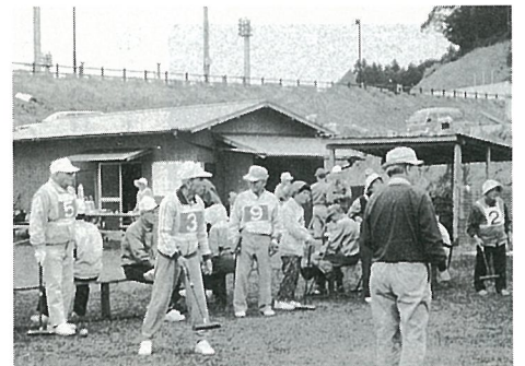
▲日吉地区ゲートボール場で行われた大会

篠本一区が初優勝 日吉地区生きがい対策事業と日吉郵便局長杯を兼ねたゲートボール大会が、運動公園脇の日吉地区ゲートボール場で開催されました。 この大会は、10月31日に行われ、10チーム70人が参加して好ゲームを展開しました。