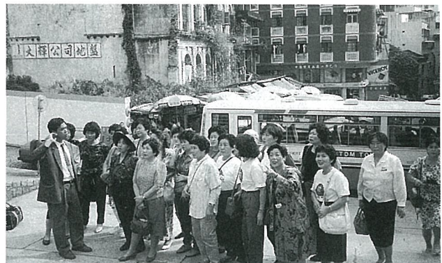
改修中のマカオ聖ポール天主堂跡を見学

たしました。個人経営としては最大の規模を誇るものであり、中流階級以上のものでなければ入居できません。ベニヤ版で仕切った薄暗い小さな部屋、薄黒い布を掛けて寝ているお婆ちゃんもおりました。またある老人は、「ジャパンだめ」と言うかのようにようにドアを閉めてしまいました。最後にお会いした老人は、私たちが歓迎してくれました。そこで恥かしく感じたことは、英語の出来ない自分でした。