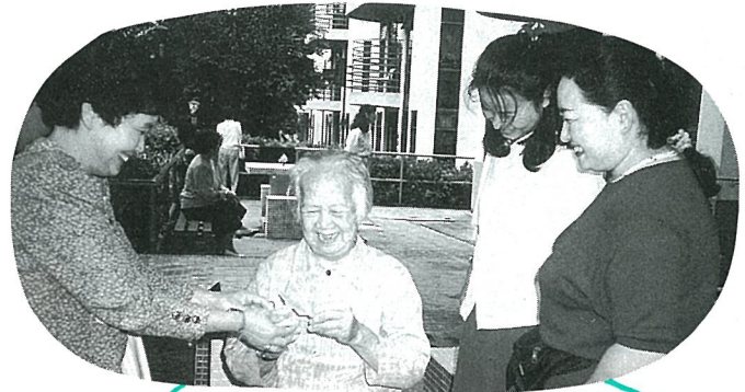
折り鶴のプレゼントにニッコリうなずき喜んでくれました

香港、ダイヤブロックを積み上げたかのような高層ビルの林、そしてダイヤのように輝く繁華街のネオン、それは正に百万ドルの夜景でありました。また、その反対に今にも崩れ落ちそうなマンション、そして家も無く小さな船にホコを覆い陸に上がることのできない水上生活者もおりました。香港の中心地より車で約80分程走り緑豊かな田園地帯に建てられた松柏老人ホームを訪問い