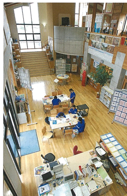
教科専用教室に隣接した学習空間 手前は教師ステーション

※今後、先生方との打ち合わせにより、細部にわたり、より具体的な検討作業が進められます。