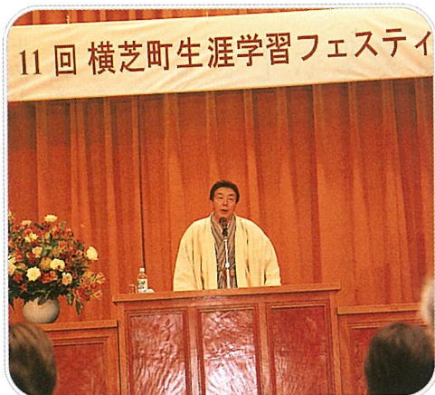
▲「人生は楽しく、面白い」三笑亭夢之助