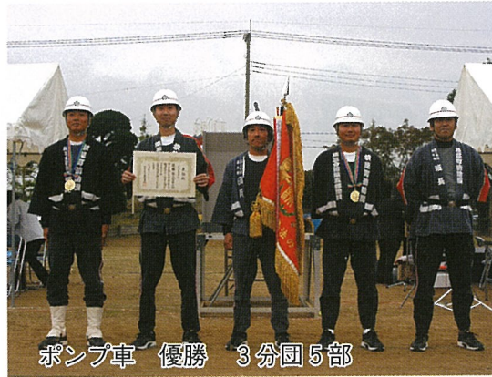
ポンプ車 優勝 3分団5部