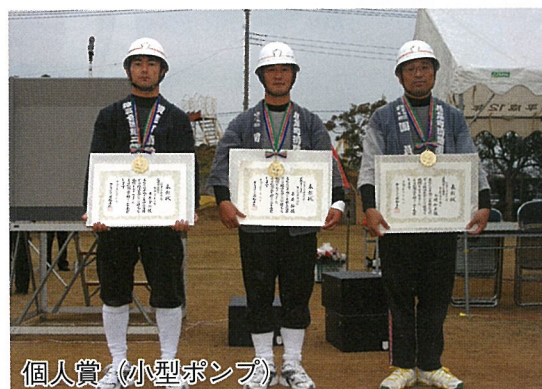
個人賞（小型ポンプ）