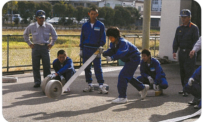
▲消防署（横芝分署）にて

『貴重な体験ができた。学んだことを生かしてゆきたい。』『仕事の大変さや楽しさがわかった』など、前向きな感想を聞くことができました。