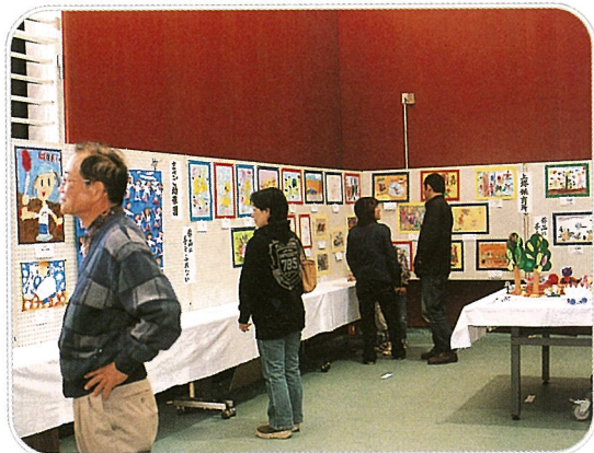
▲作品展も力作ぞろい