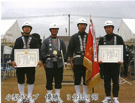
小型ポンプ 優勝 3分団2部