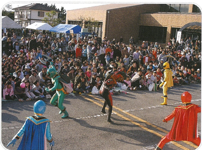
▲マジレンジャーは、チビッコ達に大人気