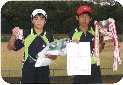
左..印東・右..伊藤組