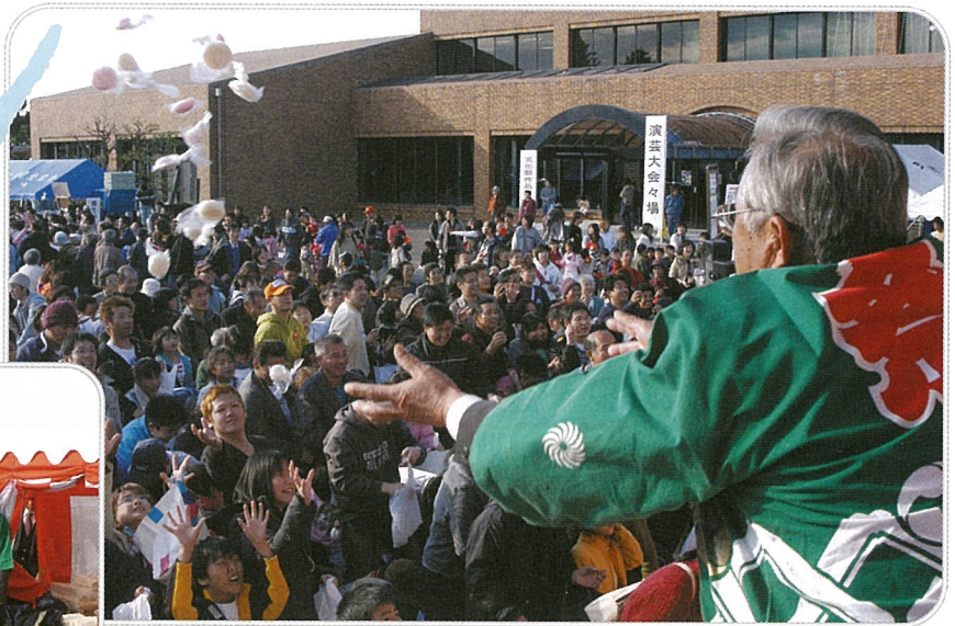
▲フィナーレは“紅白餅投げ”