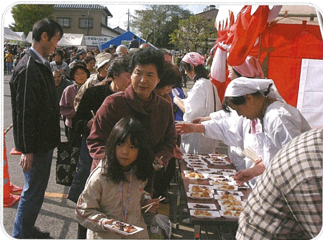
▲つきたてモチは、長蛇の列