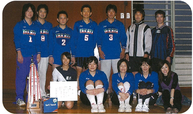
▲第11ブロックのみなさん

【主な結果】 優勝 第11ブロック（屋形） 準優勝 第4ブロック（上町） 第3位 第8ブロック（鳥喰全区）