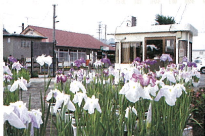
▲日本の伝統園芸植物“花菖蒲”展示 (6/22 JR横芝駅前)