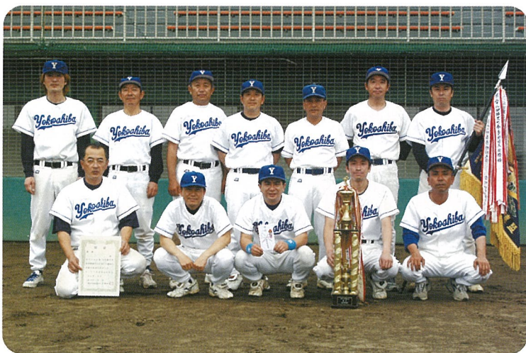
▲優勝した“横芝ニュースターズ”のみなさん

決勝は、ベテラン選手中心の横芝ニュースターズと若手選手をそろえたピースの対決。2回までに7点をリードされたニュースターズがじりじりと追い上げ5回に6点を取り逆転。13対7で横芝ニュースターズが春の王者となりました。