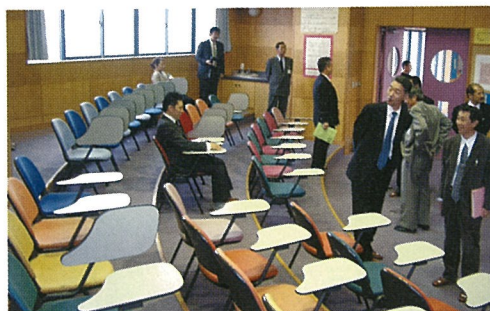
先生方による打瀬中の視察（幕張）

など、さまざまな立場の方に参加していただき、ご意見を聴きながら今後の設計に活かしていくことになっています。