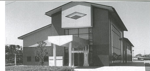
健康福祉センター「プラム」

※基本健康診査の会場(プラム)で実施します。対象者は、基本健康診査の受診者のうち希望する者となり、先着90名までとなります。