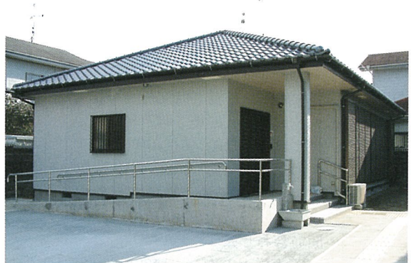
▲桜台集会所（北清水）