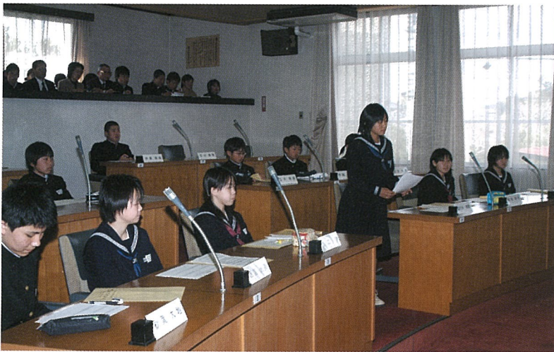
▲本会議場でちょっと緊張気味の“中学生議員”

この模擬議会は、学校から選出された“中学生議員”17名が参加し、町執行部を相手に代表生徒9名による一般質問を行ったほか、傍聴席にも8名の生徒が見学する、という方式で行われました。