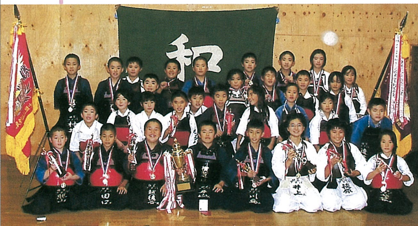
▲フタバ剣友会の“小学生剣士”