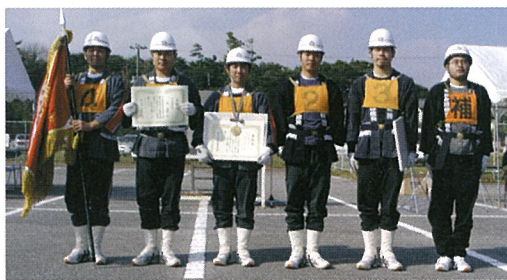
ポンプ車 優勝 3分団5部のみなさん