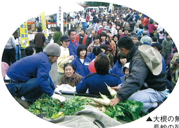
▲大根の無料配布に長蛇の列