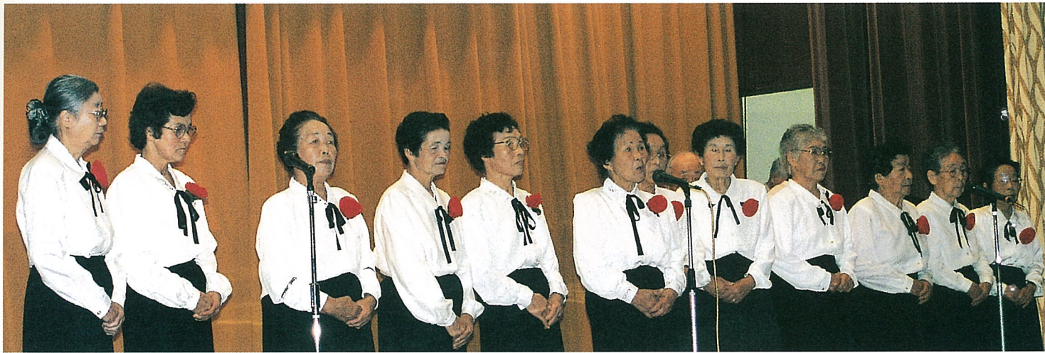
▲日頃の練習の成果を熱唱・熱演▼