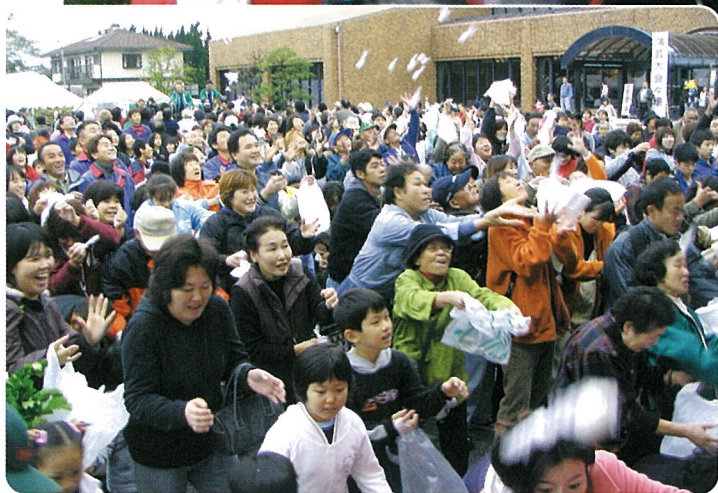
▲大盛況の“紅白餅投げ”