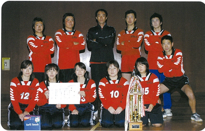
▲第3ブロックのみなさん

大会は、9人制ルールで男女混合によりチームを編成して行われ、決勝戦は、第3ブロックと第7ブロックの対戦となり、第3ブロックが昨年に続き2年連続優勝を飾りました。