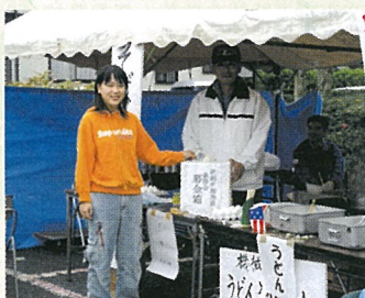
▲善意の募金(新潟県中越地震)ありがとう。 (農業祭・文化祭会場)