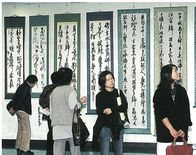
▲どれも力作ぞろい▶