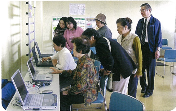
▲パソコンで長寿度テスト