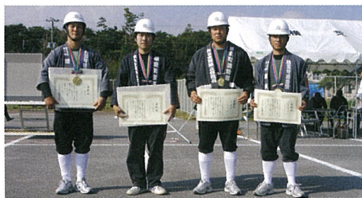
個人賞（小型ポンプ）