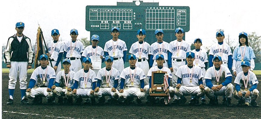
見事優勝旗を手にした「横中野球部」(ふれあい坂田池公園野球場)