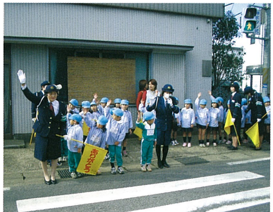
▲“右”みて!“左”みて! さあ、渡りましょう

園児たちは、楽しみながら一生懸命に交通ルールを学んでいます。ドライバーのみなさんも小さな子どもを目にしたときは、アクセルを少し緩めゆとりある運転、お願いしま〜す。