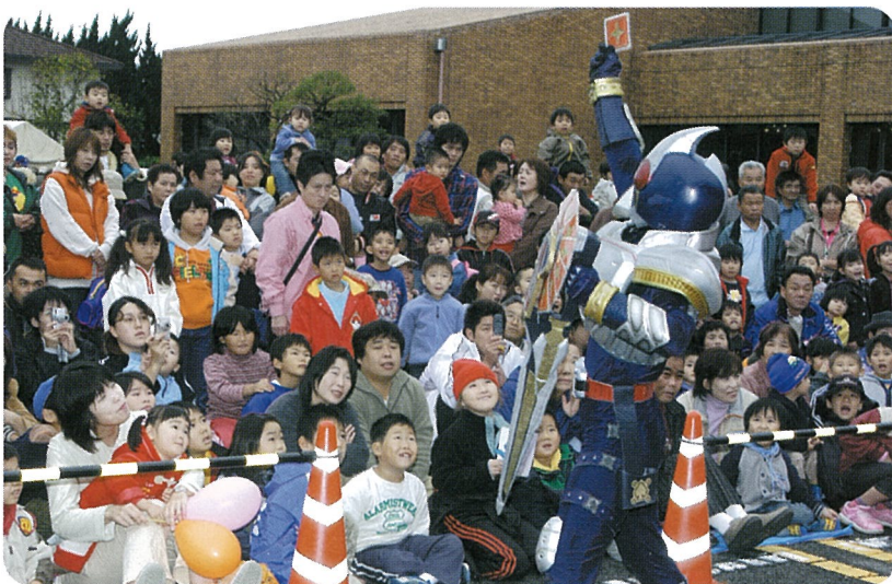
▲家族連れは“仮面ライダー”に釘づけ

恒例となっている秋のイベント、「生涯学習フェスティバル」「町民文化祭」「農業祭」が11月13日と14日、町文化会館・海洋センターを会場に開催されました。両日とも、大勢のひとで賑わい地元横芝の深まり行く秋をみんなで満喫しました。