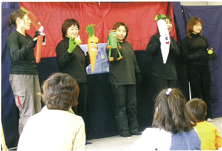
▲指人形劇「にんじんとだいこんとごぼう」