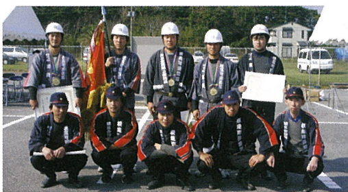
小型ポンプ 優勝 3分団2部のみなさん