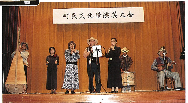
町民文化祭演芸大会