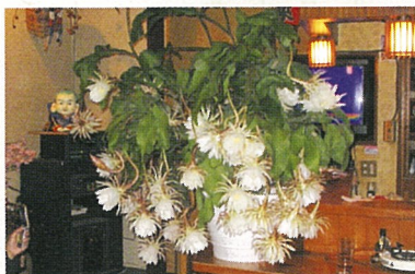
▲一夜限りの花“月下美人” 撮ってもらっちゃいました！(北清水)

★都合により変更になる場合があります。問い合わせは、山武郡市広域行政組合消防本部指令課 ☎0475(52)4137へ。