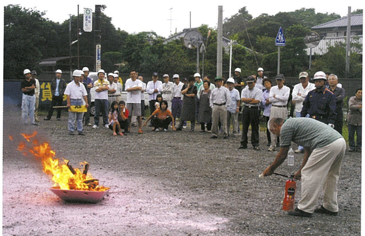
初期消火訓練（テンダーヴィラ駐車場）

訓練は、5日早朝、町職員と消防署員・消防団員を対象とした召集訓練に続き、地区住民の避難訓練・初期消火訓練等が行われ、三本松集会所では土のう作り、積み土のうを体験するなど本番さながらの訓練となりました。