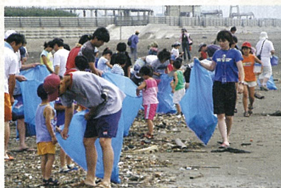
▲海のつどいは、ゴミ拾いから始まりました。 (7/18 屋形海岸)

※心の健康相談は予約が必要です。 山武健康福祉センター ☎0475-54-0611