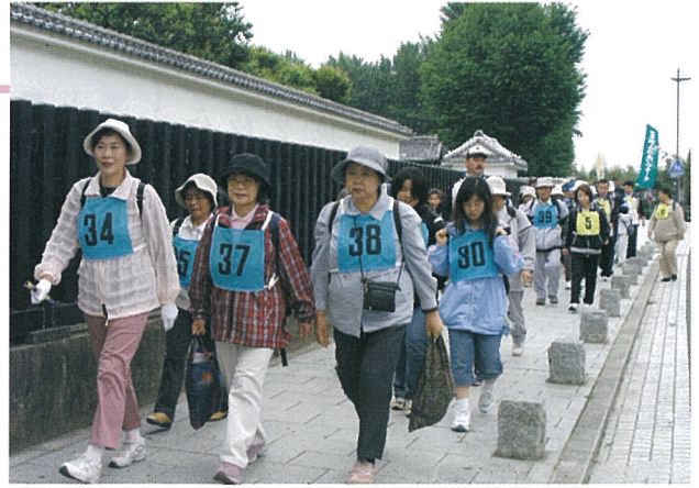
足どりも軽く、偕楽園へ出発

雨のため延期になっていた、第27回横芝町ふれあいウォークが、5月23日に行われ、家族連れなど55名の参加者は水戸へ。今回は、水戸弘道館から千波湖をとおり偕楽園までの約5キロのコースをやや肌寒い気候でも、家族や友達とおしゃべりをしながら楽しく歩くことができました。