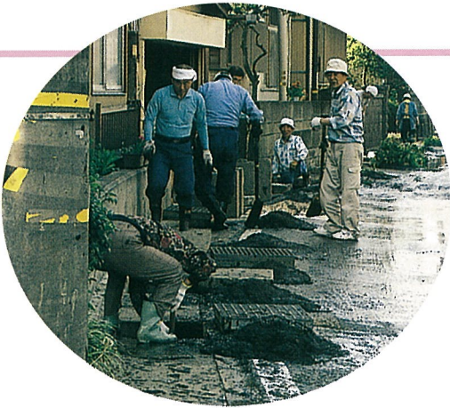
側溝にもこんなに“ドロ”が

昭和52年に始まった「町内一日清掃」。今年はゴミゼロにちなみ、5月30日に行われました。 蒸し暑い日となった当日、朝早くから大勢の皆さんが参加し、道路わきの草刈、側溝清掃や空き缶、ゴミなど合計8・72tが集められ、町内がきれいになりました。 ご協力ありがとうございました。