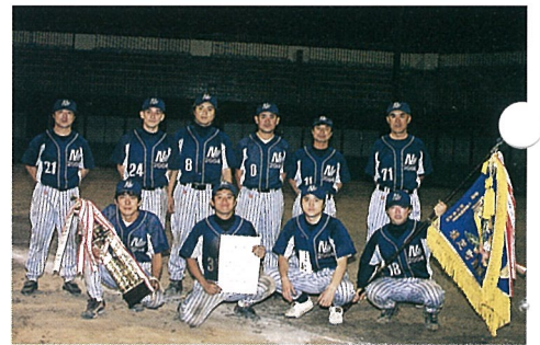
優勝した新島ハリケーンズのみなさん

優勝 新島ハリケーンズ 準優勝 ウイドーズ 第3位 ブルーラビッツ あつ田マリズ