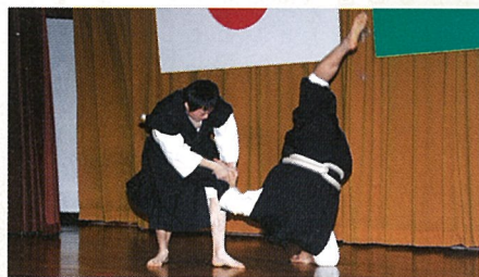
少林寺拳法は、昭和22年日本で創設された護身の技術です。 (横芝敬愛高校少林寺拳法部 1/9:町新年交歓会)