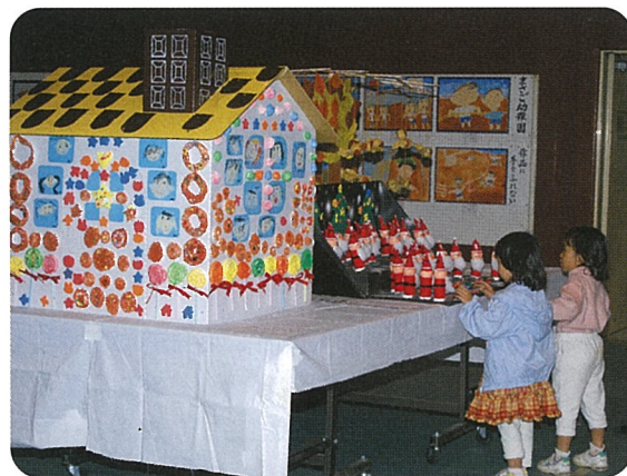
▲かわいい作品に足も止まります