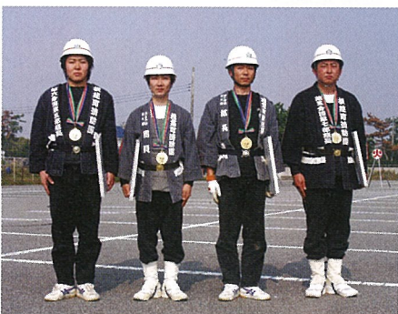
▲個人賞 (最優秀) : 小型ポンプ