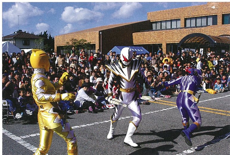
▲子供達に大人気“アパレンジャーショー”