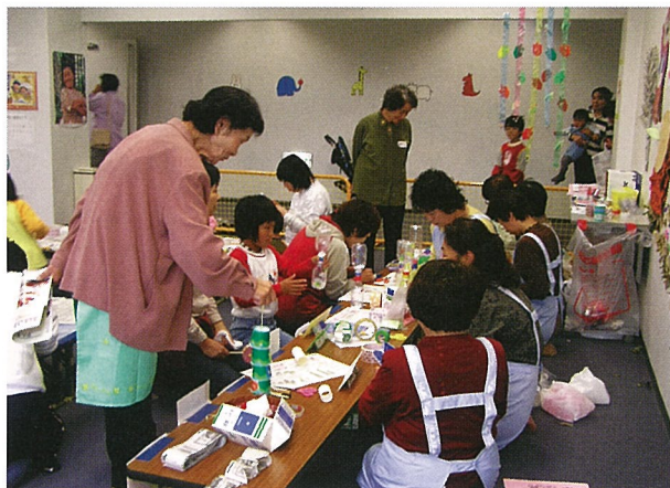
▲手作りおもちに挑戦

当日は、血管年齢・味噌汁塩分・アルコール体質判定など健康祭りならではの測定が行われたほか、健康体操やハイハイコンクールなど赤ちゃんから大人まで、楽しみながら健康について考える一日を過ごしました。