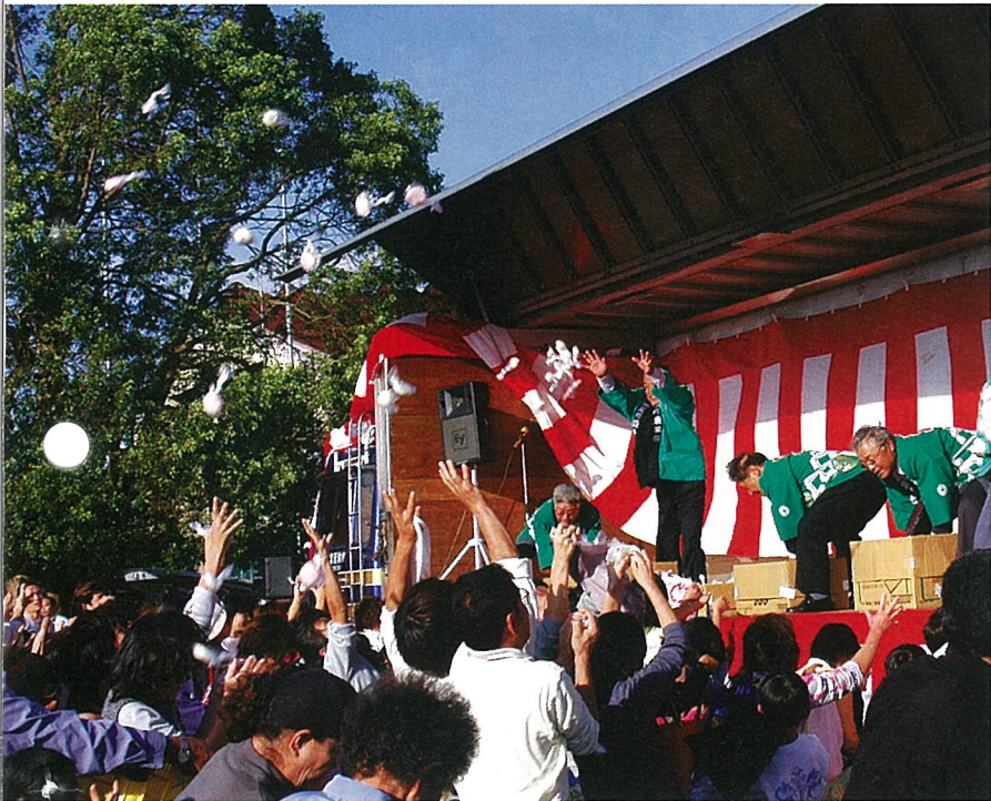
▲農業祭のフィナーレを飾る“もち投げ”

秋の一大イベント、「町民文化祭」と「農業祭」が11月15日、16日、町文化会館及び海洋センターを会場に開催されました。合同開催となつて今年が4年目、「芸術」「文化」「収穫」それぞれの「横芝の秋」をみんなで満喫し、会場は大勢の方で大変賑わいました。