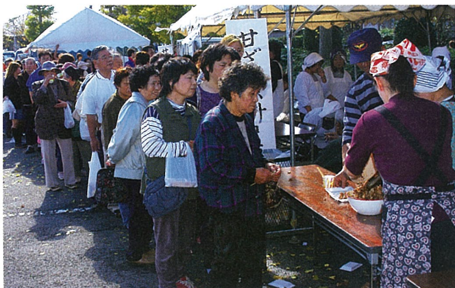
▲焼肉の良い匂いに誘われてこの行列