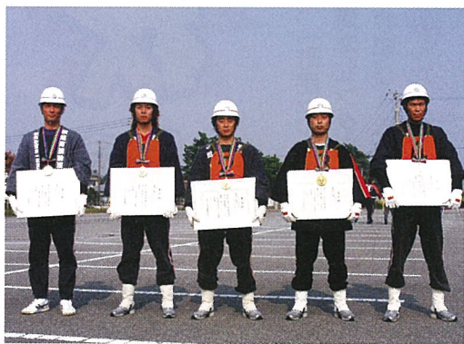
▲個人賞 (最優秀) : ポンプ車