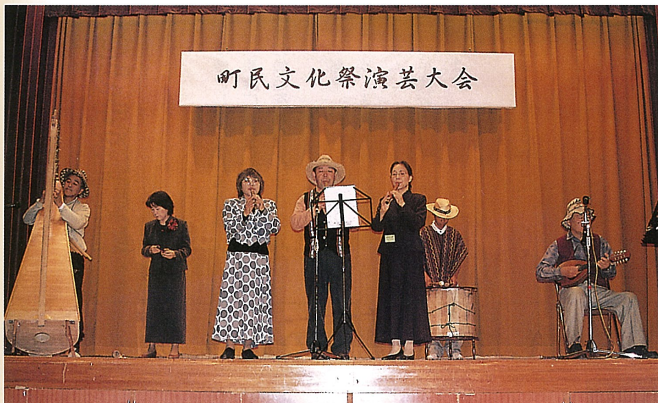
▲日頃、練習しているケーナなどめずらしい楽器の演奏