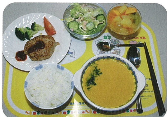
▲ごはん、ハンバーグ、サラダ、かぼちゃスープ、フルーツポンチ

料理は、ハンバーグなど下ごしらえから準備する本格的なもの。出来上がった料理の試食に笑顔も栄養も“満点”の料理教室でした。