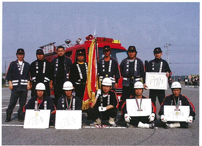
ポンプ車 優勝 2分団2部のみなさん