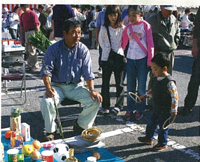
僕の狙いは、サッカーボール!