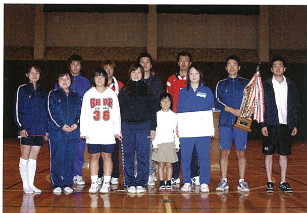
▲優勝した第3ブロックのみなさん