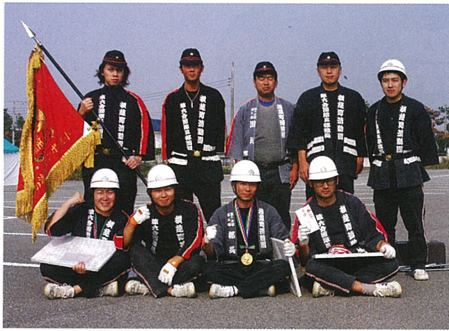
小型ポンプ 優勝 6分団3部のみなさん