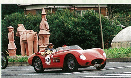
松尾・横芝インターを走り抜けるクラシックカー ドライバーは“塚 正章” 【1956年式 MASERATI 150S】 (10/8)