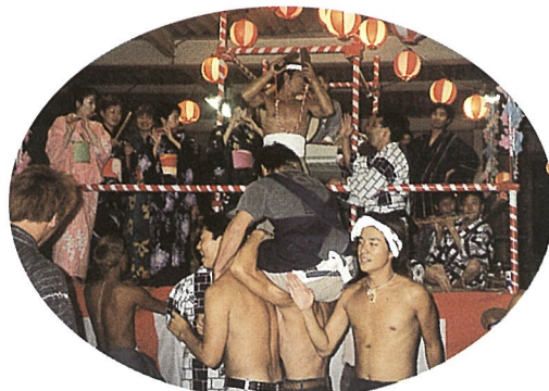
東町向後商店倉庫 8/16