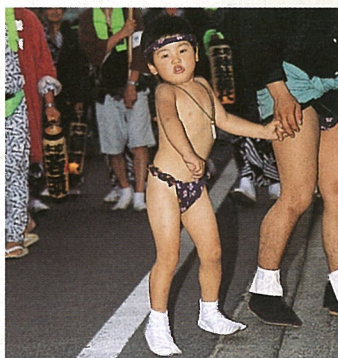
「祭りの男」はフンドシだよね！ お父さん 8月3日 抵園祭