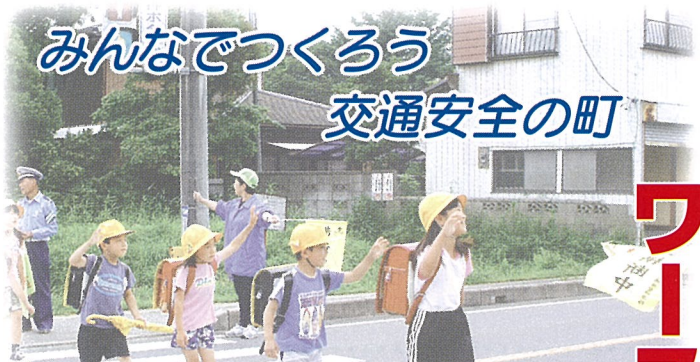
みんなでつくる 交通安全の町

しかしながら、合併特例法の期限（平成17年3月）が迫っている中、成田市や他の空港圏域市町村の状況を考えると、今は将来成田市の合併に力を蓄えるべく、横芝町と同様、山武地域の合併に加わらず、空港問題を抱えている芝山町との合併を推進し、空港南側地域の礎を築くべきである。よって芝山町に対し、横芝町との二町での合併を強く要望する。