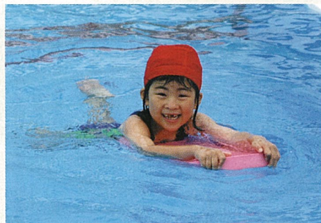
ひと足お先に夏満喫 気持ちい～

★都合により変更になる場合があります。問い合わせは、山武郡市広域行政組合消防本部指令課 ☎0475(52)4137へ。