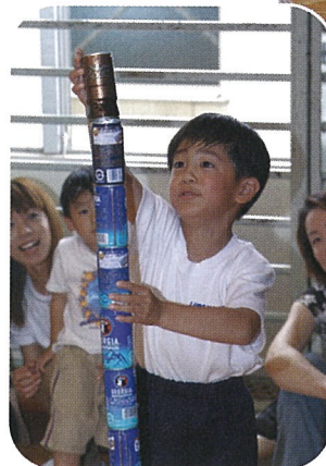
そ〜っとね、「空き缶積み」

挑戦するのは、「空き缶積み」「しりとり」「マッチ棒重ね」「雑巾がけ20m走」などユニークなものばかり10種目。参加した子供たちは、戸惑いながらも真剣に記録に挑戦。会場は元気な声が響きわたっていました。