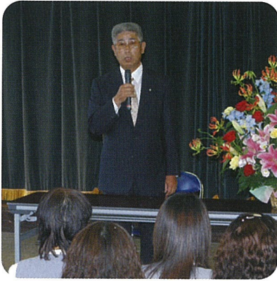
公民館講堂に集まった職員へ訓示

今後とも変わらぬご指導、ご支援を賜りますようお願い申し上げます。終わりに町民の皆様のご健勝とご多幸をお祈り申し上げます。ご挨拶いたします。