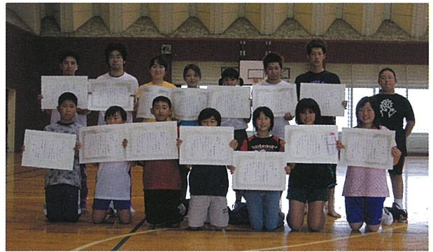
個人戦入賞のみなさん