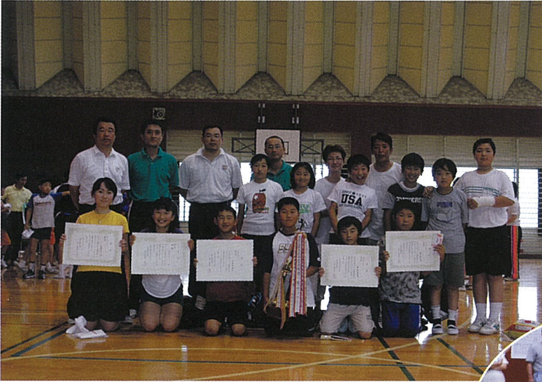
団体戦“優勝”第1ブロックのみなさん

6月22日、海洋センター体育館を会場に町民卓球大会が開催されブロック対抗による団体・個人戦が行われました。団体戦の決勝リーグは、大総地区3ブロックの戦いとなり第1ブロックが見事優勝しました。