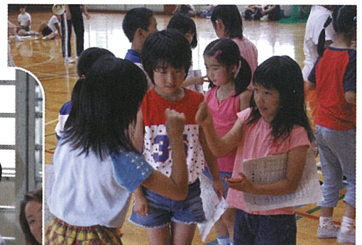
最初は、ゲー「1分間ジャンケン」