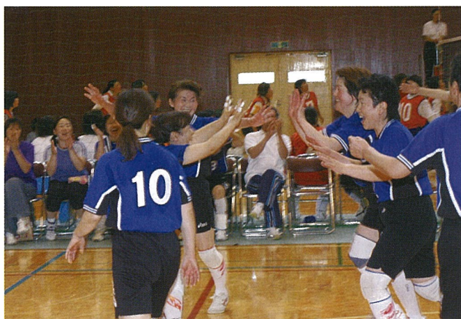
チームワーク抜群の横芝ワールドのみなさん