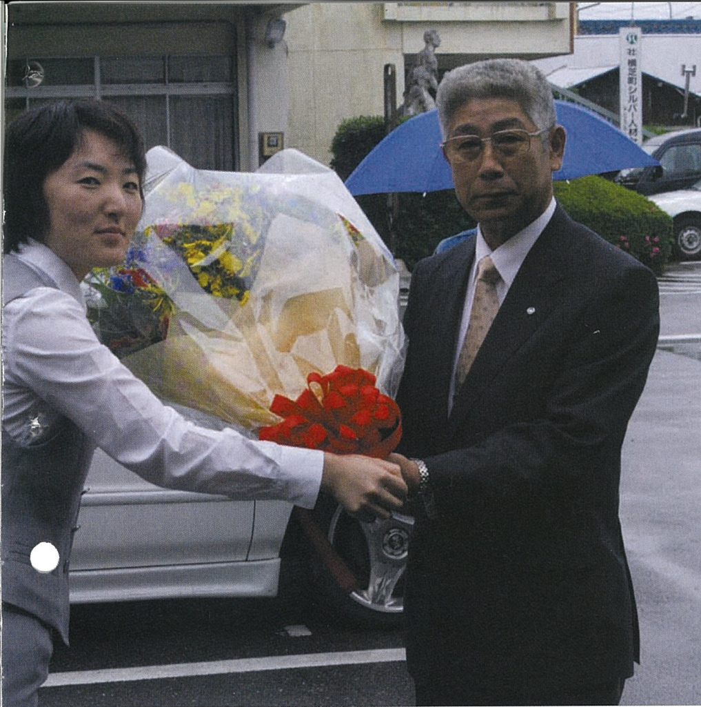
6/17初登庁、役場玄関前で職員から花束を受け取る伊藤町長

この度の横芝町長選挙に際しましては、多くの皆様からのご支援をいただき、去る6月17日、新町制施行後7代目の町長として就任いたしました。