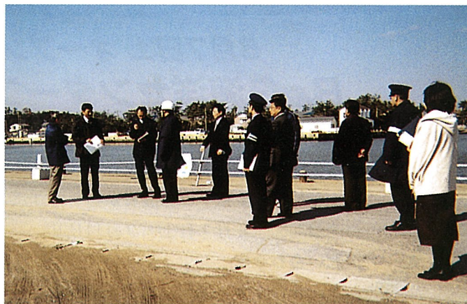
▲屋形海岸周辺の防犯診断を実施