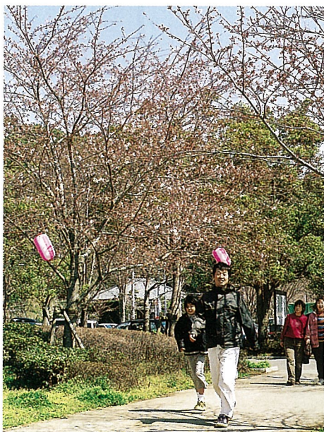
▲満開にはちょっと早いな～