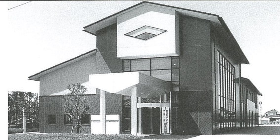
健康福祉センター「プラム」