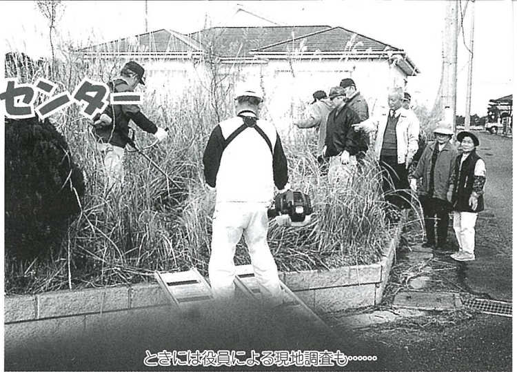
ときには役員による現地調査も