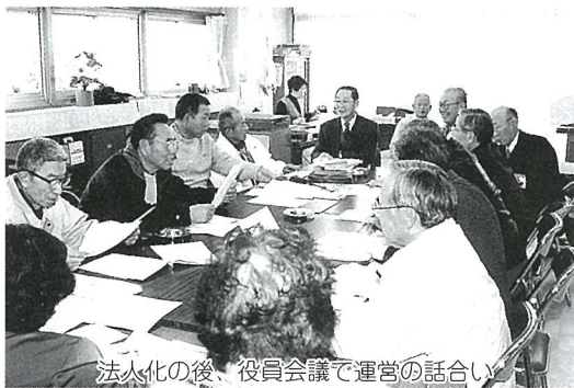
法人化の後、役員会議で運営の話合い

様々な経験をもった会員がいて、あなたの困ったことの力強い味方になるでしょう。利用料も低く抑えられています。ぜひお試しください。詳しいことは、同センター(82-7243)へお問い合わせください。