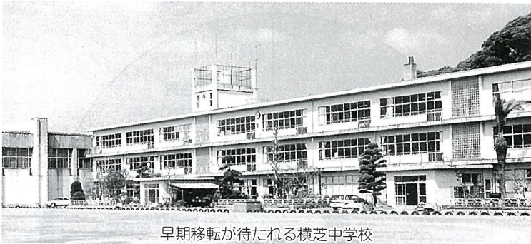
早期移転が待たれる横芝中学校

画段階でその必要性や緊急性等十分検討し、常に現状の財政状況を認識し可能な限り事業費の削減を図るよう努めること。 また、職員の配置については全ての課等の実情を考慮し適切な配置を心掛け、人件費の削減に努力すること。