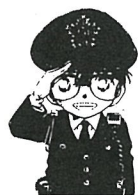
協力 少年センター