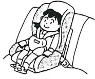
幼児用 (4か月~4歳程度)