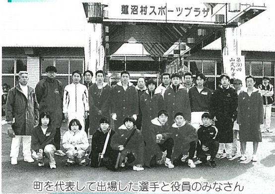
町を代表して出場した選手と役員のみなさん