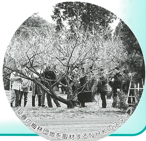
早生の梅林団地を取材するNHKのスタッフ

町の木に指定されている「梅」は、冬のきびしい寒さに耐え、早春に咲く気品の高い花として、昔から日本人に愛されてきました。町内の各家庭の庭先でもよく見かけられますが、坂田城址跡には約一・七〇〇本の梅林団地があって、開花期には多くの方の目を惹きつけてくれています。