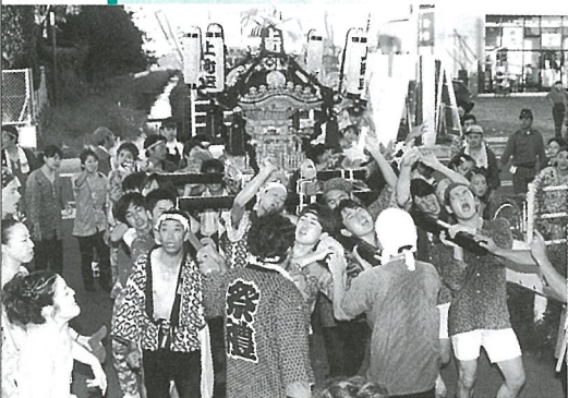
祇園祭り (上町・本町・東町)