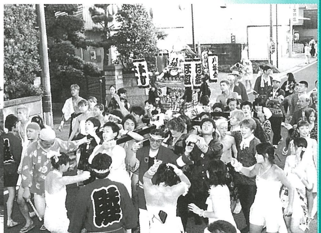
女性の踊りが加わって本町のみこし