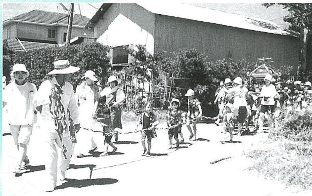
子どもたちによって地区内をゆくみこし (新島夏祭り)

夏本番の8月を迎え、今年も町内各地区で夏祭りが行われました。お囃子の笛と太鼓に導かれ、みこしが町を練り歩きました。 ここでは、楽しかった時を写真で振り返ってみました。