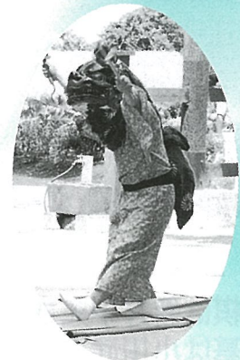
静々と舞う平獅子 (木戸台・風祭り)

夏本番の8月を迎え、今年も町内各地区で夏祭りが行われました。お囃子の笛と太鼓に導かれ、みこしが町を練り歩きました。 ここでは、楽しかった時を写真で振り返ってみました。