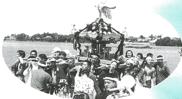
稲穂がゆれる、里々をめぐるみこし (北清水・夏祭り)