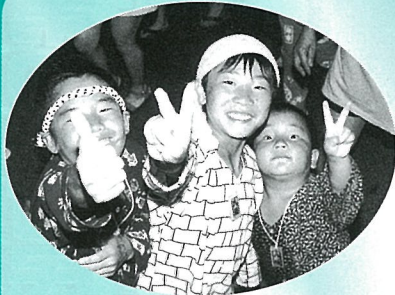
とびっきりの笑顔でポーズ