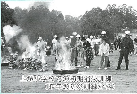
上塚小学校での初期消火訓練 (昨年の防災訓練から)

なお、詳しい訓練内容等については、8月中旬頃に地区総務員さんを通じてチラシ等を配布する予定です。