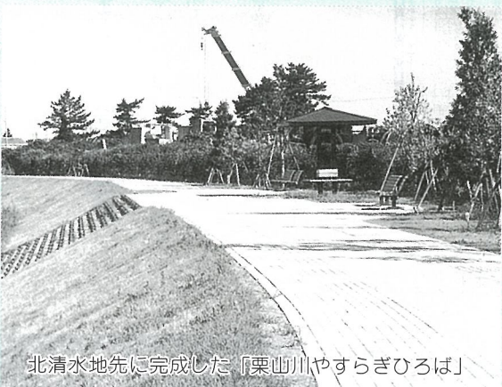
北清水地先に完成した『栗山川やすらぎひろば』

栗山川小広場も、この整備計画に基づいて建設が進められていたもので、まもなく完成しますので「水辺の憩いの場」としてご利用ください。