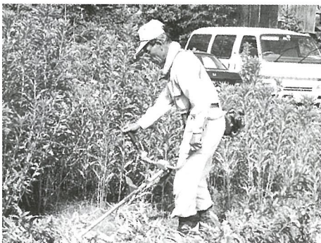
家庭より依頼された草刈り作業を行う会員