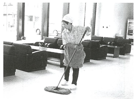
健康福祉センター「プラム」の清掃