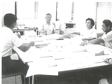
事務作業を行う会員