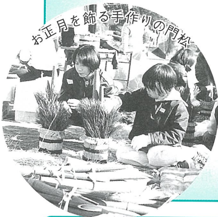
お正月を飾る手作りの門松

親子で協力して巻きつけたわりに砂を入れ、バランスよく竹と松を植えこむと出来上がり。小さいとはいえ完成品は立派な門松。 「お正月を迎える準備ができたね」そんな声もささやかれ、みなさん大事に抱えて持ち帰りました。