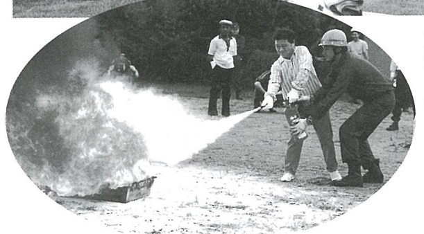
いざというときに適切な行動がとれるように