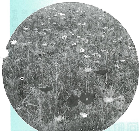
北清水地区の水田は、今“コスモスの花”が満開です

プールから帰るみなさんは「ワーきれい、私にも一束ください」と大喜びでひまわりのイラスト入りTシャツを着た女性職員のもとへ。約1時間半で用意した「ひまわり」と「コスモス」はみるみるうちに無くなってしまいました。