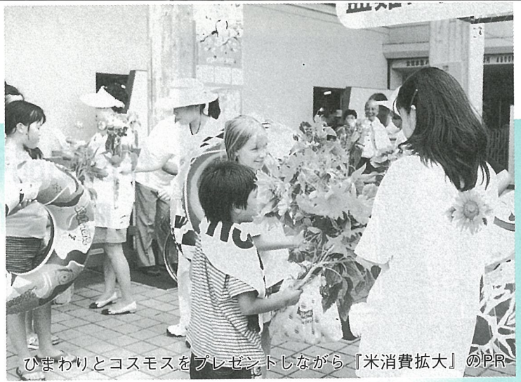
ひまわりとコスモスをプレゼントしながら『米消費拡大』のPR