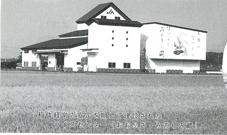
稲作経営の安定を期して建設された ライスセンター「おおふさ みのりの蔵」

当横芝町は、恵まれた自然環境の中で農業を基幹産業として発展してきましたが、近年は、農業を取り巻く環境が大きく変化しています。特に稲作経営については、生産調整面積の拡大、米価格の引下げなど大変厳しい状況にあり、今後は、消費者の要望にこたえる良質米の生産や低コスト生産が求められる時代となってきました。