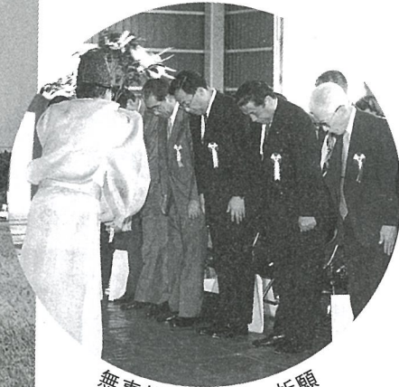
無事故を願い安全祈願