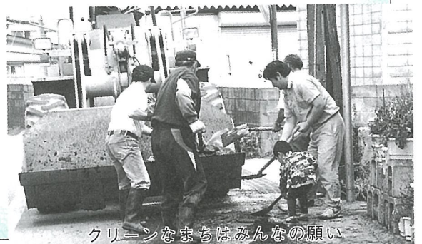
クリーンなまちはみんなの願い