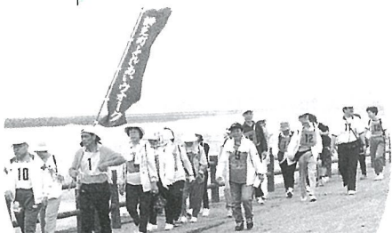
初夏の爽やかな風を身体に受けながら

水のきれいな九十九里浜の南端に位置し、南房総国定公園の起点でもある岬町。バラエティに富んだ海岸線は魅力的で、夏には、ゆるやかな曲線を描く砂浜が、格好の海水浴場へと様変わりします。今回のふれあいウォークは、そんな岬町の自然に親しむ岬めぐりを楽しんできました。 5月24日(日)、参加者90名はおなじみのペパーミントグリーンののほりを先頭に、初夏の海岸へ出発。休憩場所では、海岸の魅力を楽しみ、昼食のどん汁にお腹を満たしていました。筋肉痛を残した方も、いたようですが、みんな歩くことを楽しみに次回を待つ声も聞こえていました。