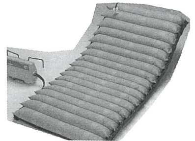
床ずれ防止のためのエアーマット