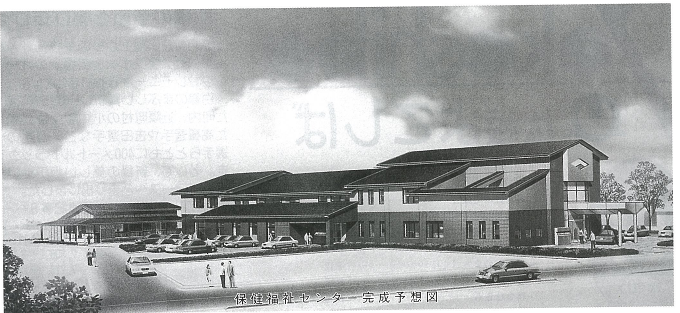
保健福祉センター完成予想図