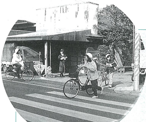
4月からの自転車通学に備えて子どもたち交通安全指導を受ける