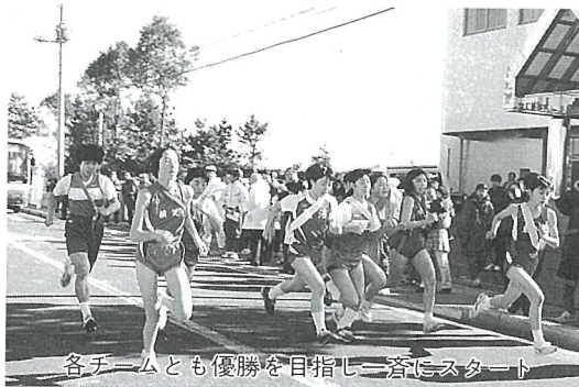
各チームとも優勝を目指し一斉にスタート