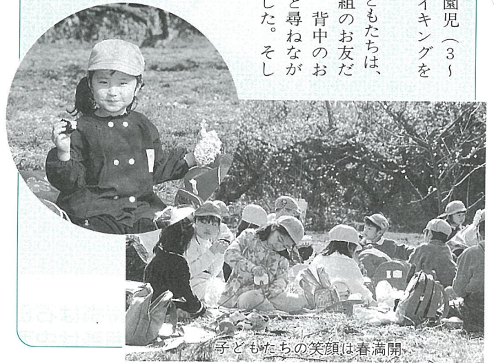
子どもたちの笑顔は春満開

ぼかぼか陽気の2月18日、上堺保育所園児(3、5歳クラス)が、坂田城跡の梅見バスハイキングを行いました。 ふれあい坂田公園でバスをおりた子どもたちは、年長のお兄ちゃん、お姉ちゃんと小さい組のお友だちが手をつなぎハイキングへ出発。途中、背中のお弁当が気になり「お弁当はまだなの？」と尋ねながらも遊歩道を元気いっぱいに登りきりました。そして、梅畑に到着するとおまじかねの「お弁当の時間」先生といっしょに手際よくシートを広げ、お母さんの作ってくれたお弁当をみんなおいしそうにほおばっていました。 梅はまだつぼみが多く満開とまではいきませんが、子どもたちの笑顔が梅畑いっばいに咲いていました。