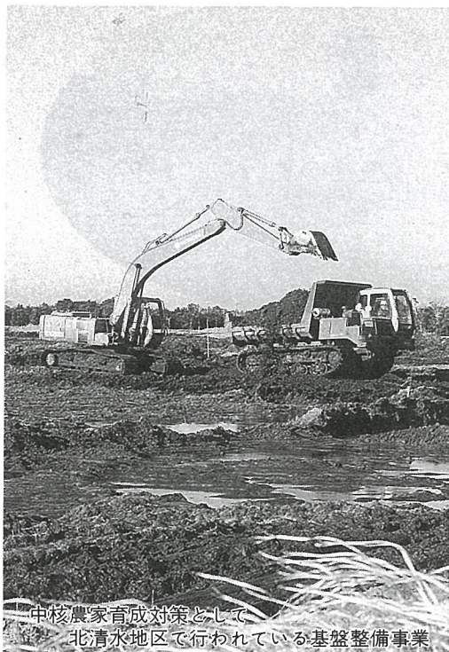
中核農家育成対策として北清水地区で行われている基盤整備事業

答 ①平成二年度と平成七年度の国勢調査を比較すると、第一次産業は四ポイント減少した反面、第二次産業が一ポイント、第三次産業が三ポイント増加しており、今後もこの状態で推移するものと思われる。第一次産業は、農業従事者の高齢化や農畜産物の自由化など全国的にさまざまな課題を抱えているが、今後は、当町の農業を発展させるには、若い人に魅力ある産業にシフトしてはならないと考えており、現在、基本構想の中で中核農家の育成対策等を講じているところである。建設・製造業などの第二次産業では、中小企業を対象にした融資資金の利子補給制度を利用してまいながら、また、卸・小売・サービス業などの三次産業では、現在、商工会