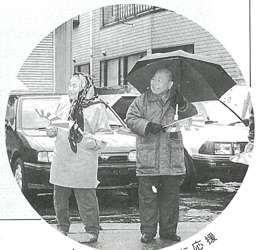
沿道では小旗を手に応援