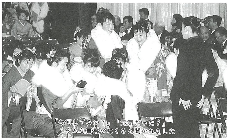
「今何してるの?」「元気だった?」 そんな言葉がたくさん聞かれました