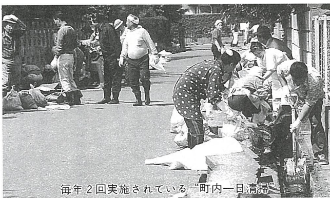
毎年2回実施されている「町内一日清掃」

答 空き缶やたばこなどのポイ捨て禁止に関する条例は、現在、千葉県内で11市7町が制定しており、郡内では山武町が平成10年1月から施行する予定になっている。この条例の制定によって不法投棄を防止し、環境美化を推進することは非常に大切なことだと思いが、それよりもまず、一人ひとりのモラルの向上がさらに重要なことだと考えており、当町では毎年2回、町民のみなさんの意識の向上を図るとともに環境の美化を推進するため「町内一日清掃」を実施している。また、今年の10月には不法投棄監視員の委嘱を行い、町内13地区で不法投棄の監視や指導に当たっていただいているので、条例制定については監視状況等を見たうえで検討したいと考えている。