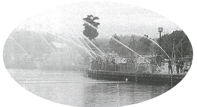
今年一年の無火災を祈って