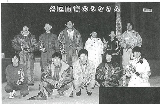
各区間賞のみなさん