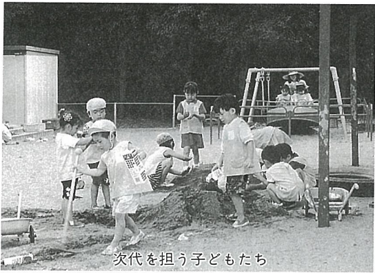
次代を担う子どもたち

問 日本の経済、社会の発展を担ってきた高齢者と、これからの世代を担う子どもたちはどちらも大事な人たちである。六十八歳以上と三歳までの乳幼児に