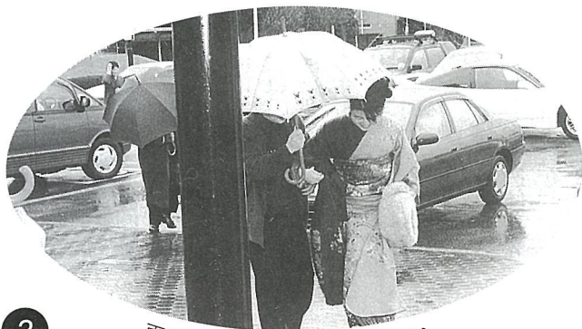
雨に濡れないよう気遣いながら

場合は、母である。 とかく「自由」を優先することばかりに目が行ってしまいがちな昨今だが、自分のしたいことをするにはそれに対しての一切を請け負う覚悟がなければならぬと思う。現在の国内の情勢にも相通することではないだろうか。 私が決意したのは、この表裏一体を基盤にして前進していく心づもりである。平担ではないであろう道を引き返さない勇気を持つことである。 最後に、この場を借りて日頃よりお世話になっている方々にお礼申し上げます。