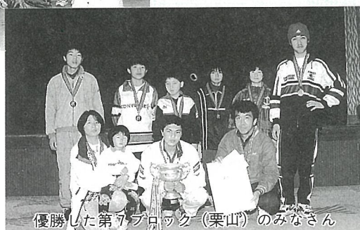
優勝した第7ブロック(栗山)のみなさん