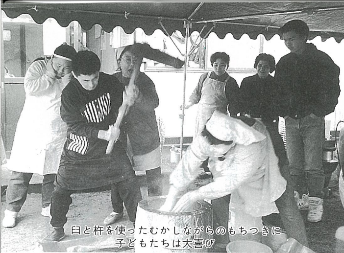
臼と杵を使ったむかしながらのもちつきに子どもたちは大喜び