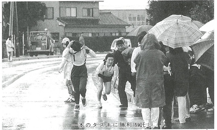
一本のタスキに勝利を託し